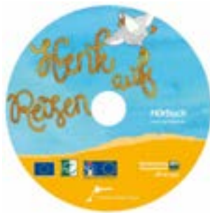
Cover Hörbuch „Henk auf Reisen“

Fischland-Darß-Zingst. Der Tourismusverband Fischland-Darß-Zingst hat erstmals einen Reiseführer für Kinder und Familien herausgebracht. In diesem 35-minütigen Hörbuch für Kinder ab drei Jahre inklusive Entdeckerheft zeigt die Seemöwe Henk vom Darß der Otterdame Rosalie aus dem Recknitztal seine Region und nimmt so die kleinen Zuhörer mit auf eine spannende und lustige (Hör-)Reise über die Halbinsel und das Recknitz-/Trebeltal. Hörbuch samt Begleitheft kosten 2,50 Euro und sind in den Touristinfos und Kurverwaltungen der Region sowie auf der Webseite www.henk-auf-reisen.de erhältlich.