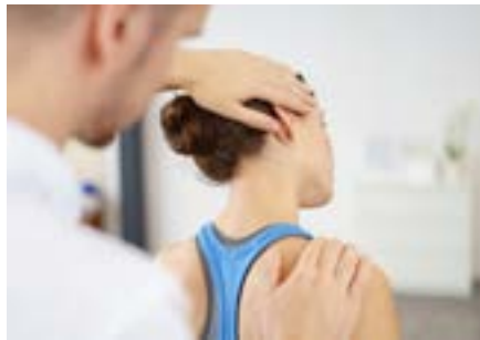
Gesundheitstouristische Angebote in MV

Für das Winterhalbjahr ist ein Qualifizierungsprozess für Orte vorgesehen, die den Gesundheitstourismus weiterentwickeln möchten. In einem Bewerbungs- und Auswahlverfahren durch eine Jury werden bis Ende September zunächst drei Orte/Regionen ermittelt, die sich für das Qualifizierungsprogramm interes-