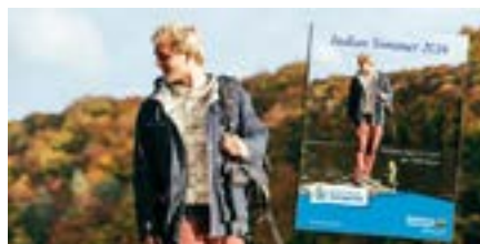
Indian Summer Broschüre 2016

Mecklenburgische Seenplatte. Der Tourismusverband Mecklenburgische Seenplatte setzt die erfolgreiche Herbsturlaubs Kampagne „Indian Summer“ auch 2016 fort. Erneut bilden das Onlineportal www.1000seen.de/herbst sowie die 16-seitige Broschüre die zentralen Elemente der Aktion mit 31 Angeboten und kleinen Geschichten über ausgewählte Reiseanlässe. Die beauftragte Onlinewerbung garantiert 100.000 Klicks. Der Indian Summer wird hier sehr emotional unter anderem mit Bildergalerien zu den Herbsthighlights kommuniziert. Die Broschüre wird in einer Auflage von 225.000 Exemplaren produziert und als Beilage von Zeitungen in Sachsen, Sachsen-An-