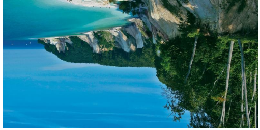
TOP Hochuferweg Wanderung