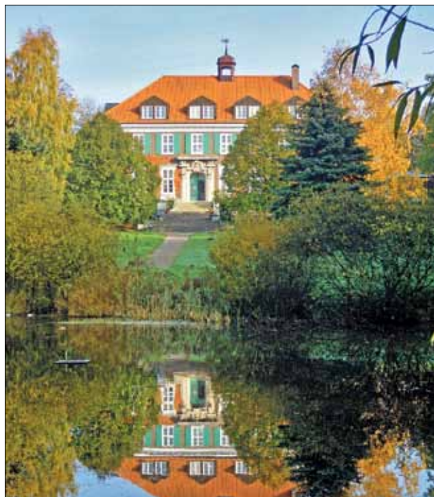
Hotel Gutshaus Stellshagen