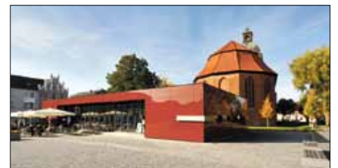
Architekten: Bastmann+Zavracky, Rostock