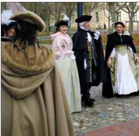
Vornehme Herrschaften auf dem Weg zum Barocken Adventsmarkt

RE 1 bis Hagenow-Land, dann OE bis Ludwigslust