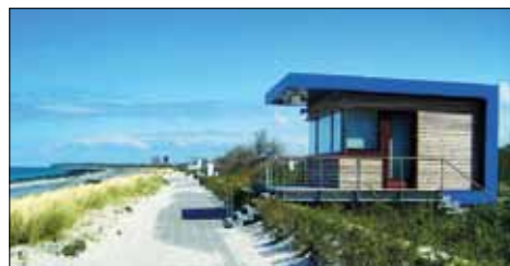
Architekten: Hass+Briese, Rostock