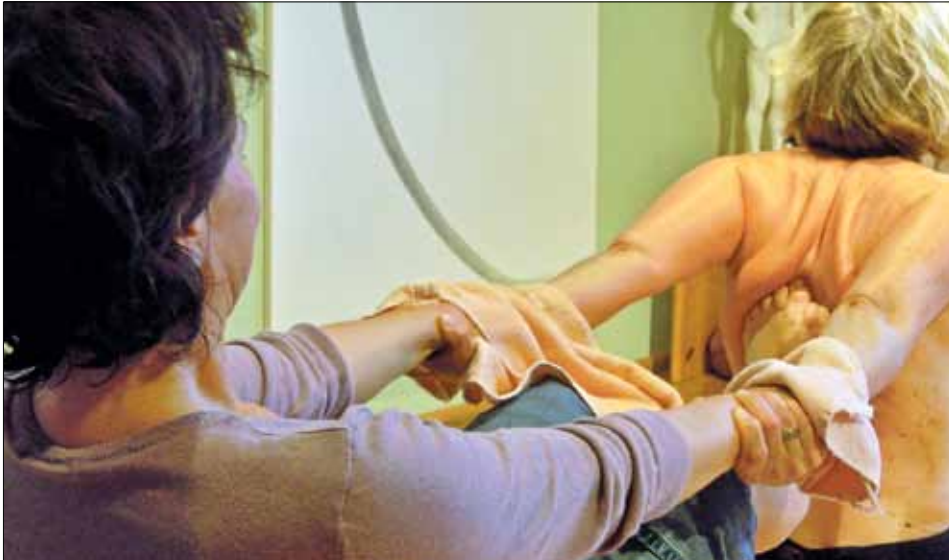
Ayurvedische Yoga Massage – wirkungsvolle Dehnung

Gästezimmern und das Tao Gesundheitszentrum. Ich kuschle mich in den Bademantel. Bei einer Tasse Kräutertee warte ich am offenen Kaminfeuer auf die erste Entspannungsmassage. Der Tag nimmt seinen Lauf. Es ist sehr ruhig, obwohl eine ganze Reihe von jungen und älteren Gästen – wohl mehr Frauen als Männer – diesen Aufenthalt mit mir teilen. Sie sind zum Mini-