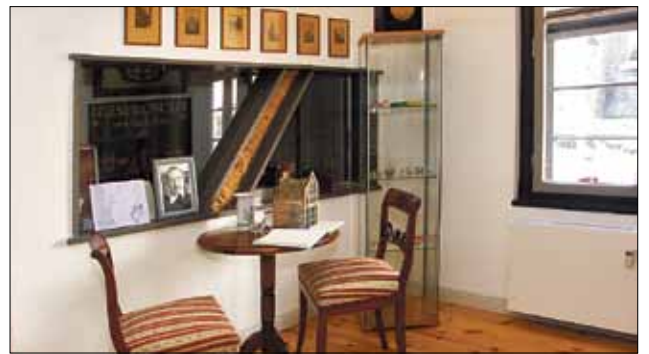
Das Werkarchiv der Sammlung Kempowskis wurde nach romanspezifischen Merkmalen gestaltet.

Einen Teil seines Werkarchivs hat der Schriftsteller Walter Kempowski seit 1993 seiner Geburtsstadt Rostock zur Verfügung gestellt. Mit der Neueröffnung der Ausstellung (anlässlich der Verleihung der Ehrendoktorwürde der Universität in Rostock 2002) im Klosterhof 3 wurden die Räume nach den romanspezifischen