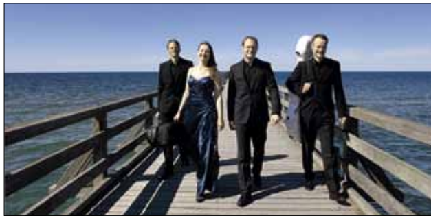
Künstlerische Leitung des Festspielfrühlings: Das Fauré Quartett