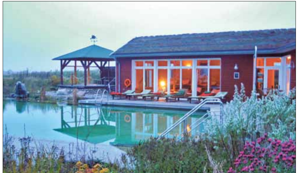
Badeteich im Tao-Gesundheitszentrum – für ganz Mutige auch in der kühlen Jahreszeit

Im Gutshaus Stellshagen macht die Zeit Pause