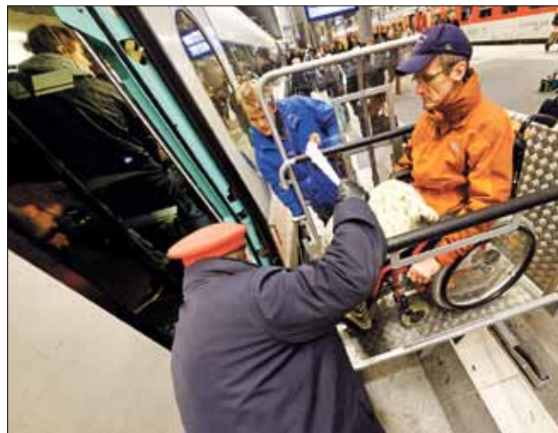
Hilfe auf den Bahnhöfen und am Zug

Sonntag oder Montag bis spätestens Samstag 15 Uhr. Geöffnet ist die Mobilitäts-Service-Zentrale: Montag bis Freitag von 8 bis 20 Uhr, Samstag, Sonntag und bundeseinheitliche Feiertage von 8 bis 16 Uhr.