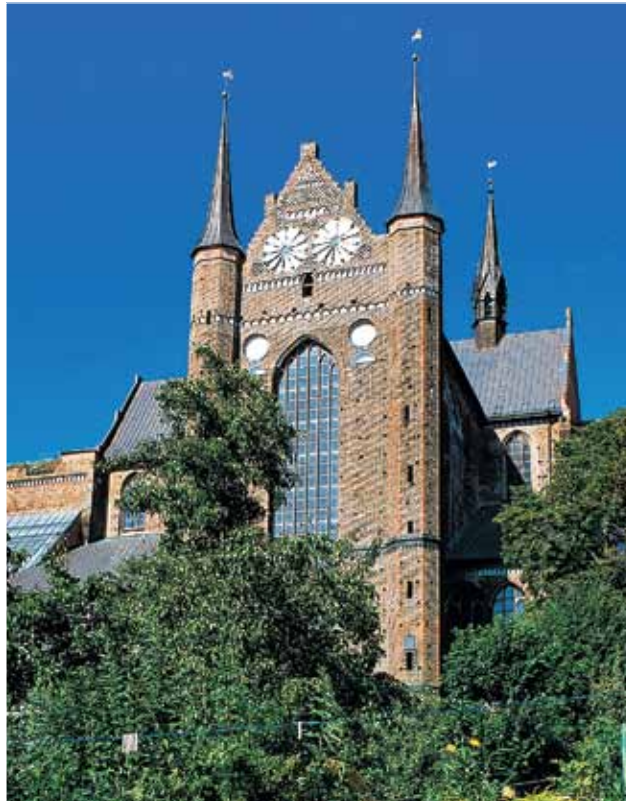
St. Georgen in Wismar hat sich als Kulturkirche fest im Veranstaltungskalender etabliert

Diese Zeitzeugen aus Backstein prägen bis heute Erscheinungsbild und Identität des Landstrichs. Und was noch viel besser ist: Viele dieser Backstein-Riesen stehen nicht nur als Monumente da, sondern sie sind lebendige Orte der Begegnung und der Kultur. Denn in den vergangenen Jahren begann man damit, hinter dicken Mauern ein