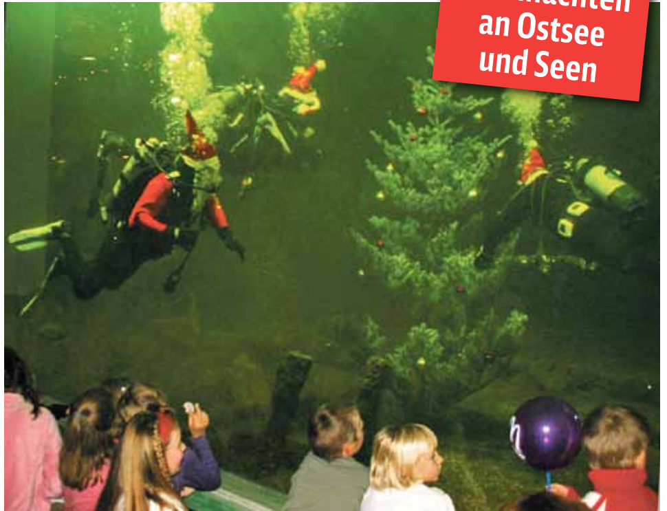
Weihnachten unter Wasser – mit geschmückter Tanne und gleich drei Nikoläusen

Nicht alle Veranstaltungen sind von Hamburg aus als Tagestour planbar, doch alle sind mit dem Zug zu erreichen, wenn man ein bisschen mehr Zeit hat. Als preisgünstige Tickets kann man – je nach Reisetag und Personenzahl – Mecklenburg-Vorpommern-, Quer-durchs-Land- oder das Schönes-Wochenende-Ticket – wählen (→ Seite 9). Informationen zu Fahrplänen und Tickets gibt es unter www.bahn.de .