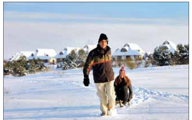
Wintervergnügen in der atemberaubenden Naturlandschaft der Mecklenburgischen Seenplatte

i Auch in diesem Jahr bietet das Van der Valk Resort Linstow wieder das beliebte „Party-Wochenenden-Arrangement“ an. Hier können an bestimmten Wochenenden im Herbst und Winter erholungshungrige Kurzurlauber ein Wochenendpaket mit ein oder zwei Übernachtungen und einer Fülle von Inklusiv-Leistungen (Übernachtung, Frühstück, Abendbuffet, Sauna, Erlebnisbad und Eintritt zu den Mottopartys mit Liveband oder DJ, Galabuffet und Showeinlagen) buchen. Die Mottos sind z. B. „Oldie Night“, „Schlagernacht“, „80er Jahre Party“ oder „Wild Wild West Party“. Ein besonderer Höhepunkt wird am 10. Dezember das Deutschlandfinale der „Mister Germany Wahl 2011/12“ sein, das wieder exklusiv in Linstow stattfindet. Wer die Festtage zu Weihnachten lieber entspannt im Hotel verbringen möchte,