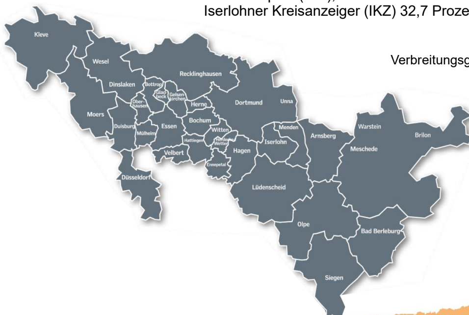
Verbreitungsgebiet des Reisejournals

Die Titel der Funke Medien NRW durchdringen die Metropolregion Rhein-Ruhr wie kein anderes Medienunternehmen. Die Titel Westdeutsche Allgemeine Zeitung (WAZ), Neue Ruhr/Neue Rhein Zeitung (NRZ), Westfalenpost (WP), Westfälische Rundschau (WR) und Iserlohner Kreisanzeiger (IKZ) 32,7 Prozent der Bevölkerung.